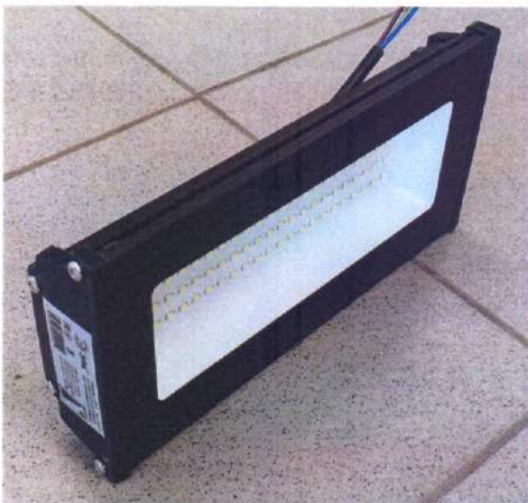
Внешний вид светильника